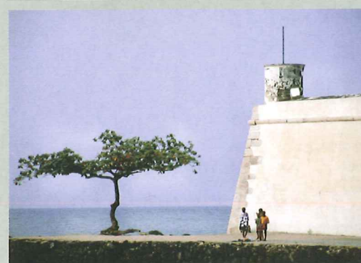
SÃO TOMÉ-STAD Het oude Portugese fort São Sebastião (1575), waar nu het Nationaal Museum is ondergebracht

Columbus-fotograaf Tom van der Leij: 'São Tomé en vooral Príncipe hebben grote indruk op me gemaakt. Voor de vriendelijke eilandbewoners zijn toeristen nog een novum die vol verbazing tegemoet worden getreden. Sommige delen zijn zo puur en ruig dat het gevoel je bekruipt dat je een reis terug in de tijd hebt gemaakt. Deze jongen liep trots met een zojuist gevangen inktvis over straat. Het beeld sprak mij erg aan dus ik heb wat foto's vanuit dit perspectief gemaakt om het dier eruit te laten springen.'