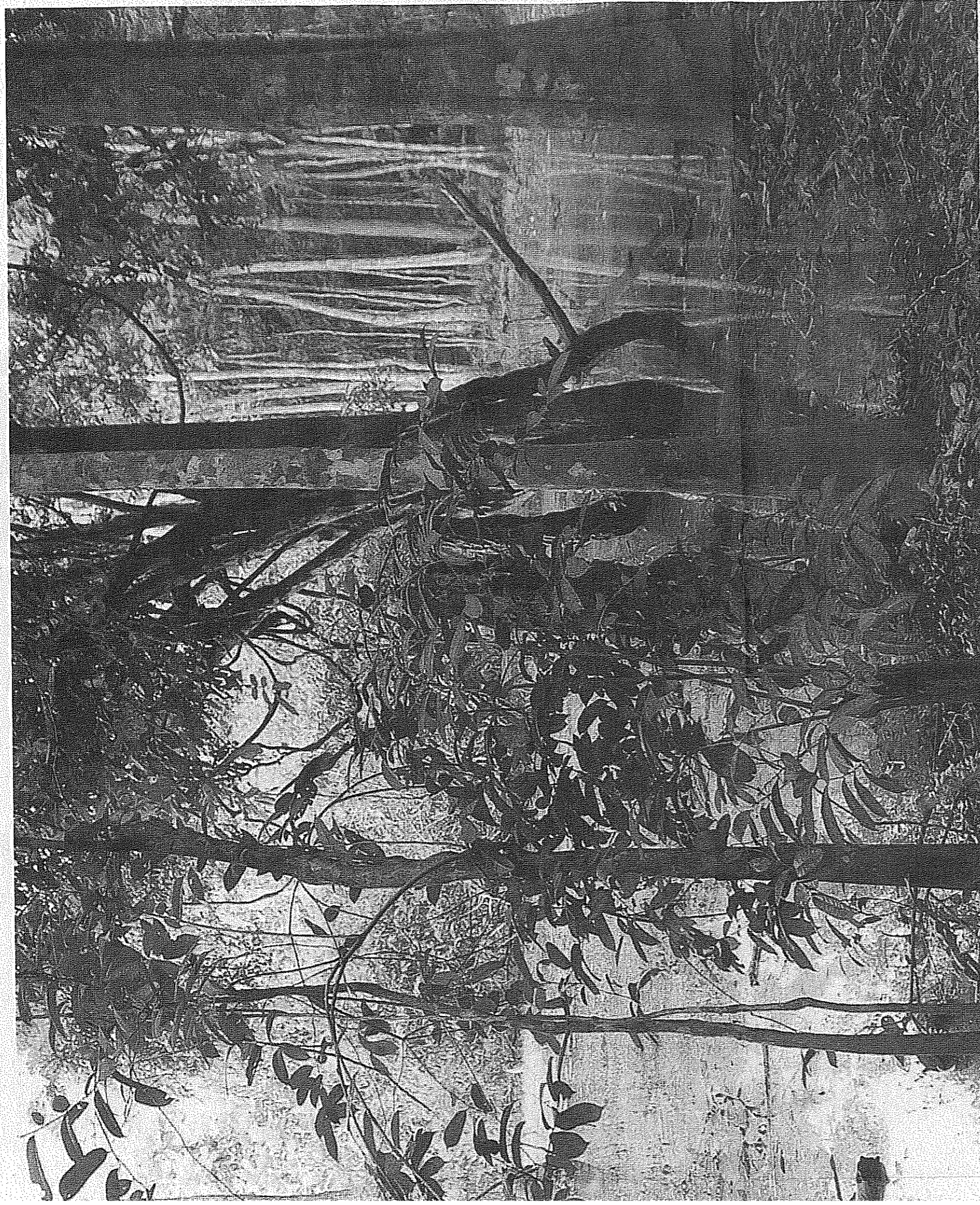
assige bladerdek en realiseer ik me dat dit het echte junglewerk is.

zijn slagstanden," fluistert mijn gids. "Dat hij het nog kan naverteren, is een wonder." Wij besluiten tegen de wind in om het dier heen te lopen.