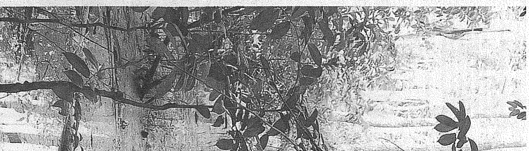
'Bij elke stap zak ik tot mijn enkels weg in het drass