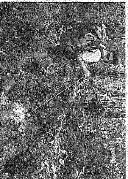
Met Dean op het olifantepad.